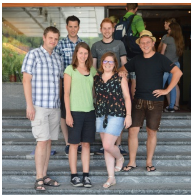
Teilnehmer aus Niederösterreich

Auch künftig sind weitere Zusammentreffen des Bundesjugendbeirates geplant, um unser Blasmusikwesen weiterzuentwickeln und Wünsche, Anregungen und Probleme zu diskutieren.